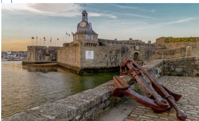
Fort de Concarneau