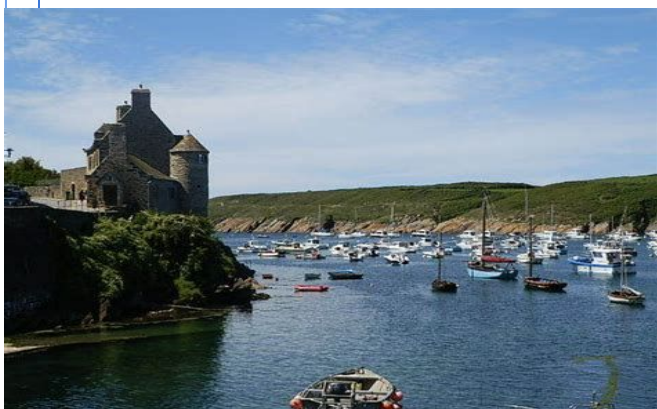
Port du Conquet