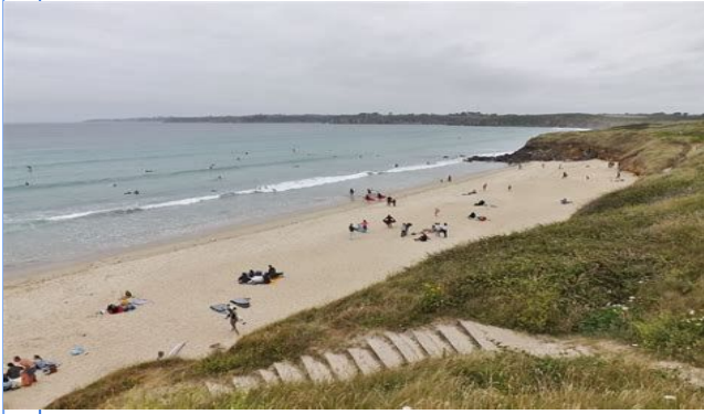
Plage des Blancs-Sablons