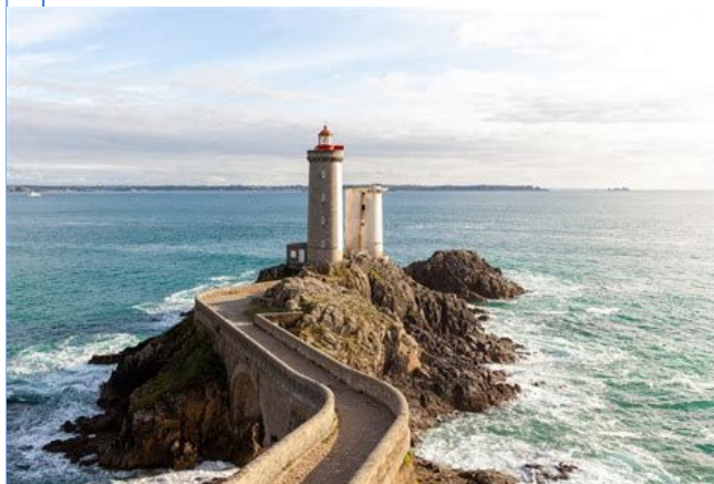
Phare du Petit Minou