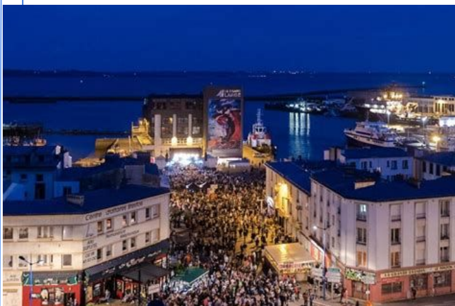
Jeudis du port 2024