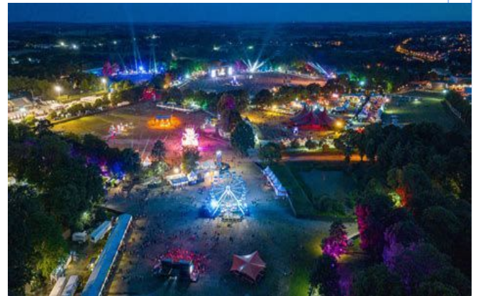
Festival des Vieilles Charrues 2024