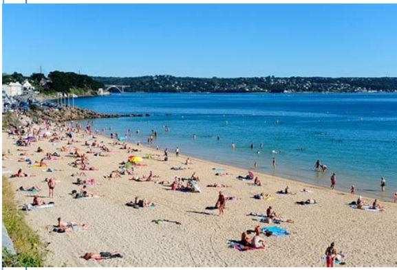
Plage du Moulin Blanc