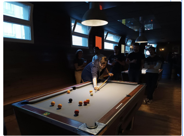
Soirée au Hamilton