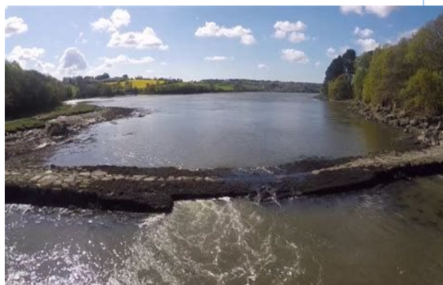
Aber Wrac'h, pont du diable