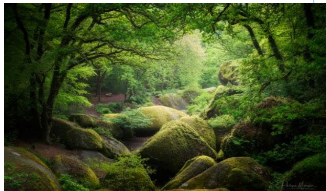
Chaos de Huelgoat